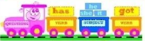
sloveso podmět sloveso